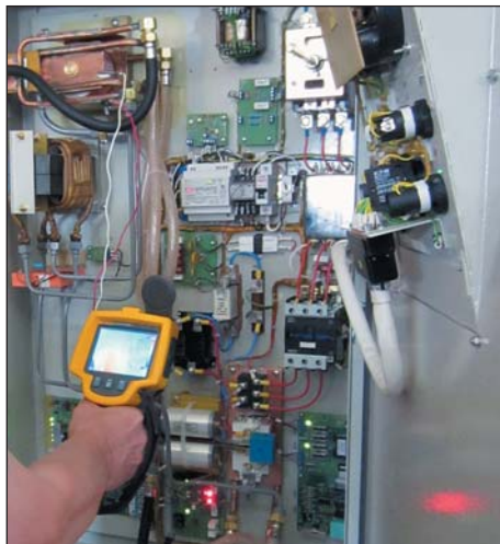
Рис. 5. Измерение температуры нагрева компонентов ППЧ

Тепловизор — современный радиационный пирометр, регистрирующий тепловое излучение тел с температурой от 20 °С и выше, предназначенный для измерения температуры с преобразованием температурного поля в телевизионное изображение с цветовой контрастностью. Его достоинством является быстрое бесконтактное измерение теплового поля испытуемого оборудования, оперативное выявление проблемных в тепловом отношении зон и одновременное измерение их температуры с достаточной для обычной практики точностью. На рис. 5 показан экран тепловизора в процессе измерения температуры силовых компонентов электрической схемы ТПЧ.