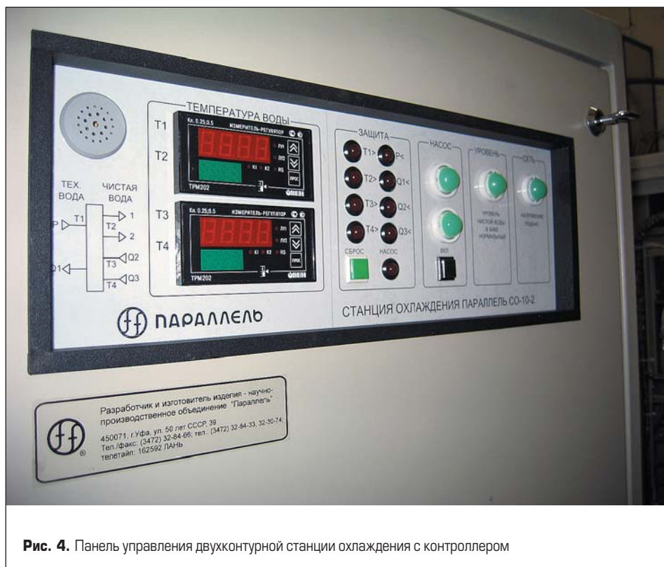
Рис. 4. Панель управления двухконтурной станции охлаждения с контроллером

Нагрев и эффективность охлаждения компонентов и узлов ППЧ регистрируются в процессе заводских испытаний в основном двумя методами: калометрированием и бесконтактным методом, с помощью тепловизора. Процесс калометрирования широко известен,