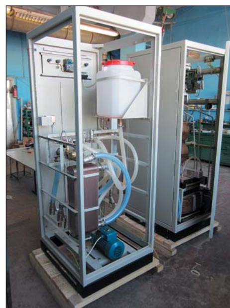
Рис. 3. Элементы конструкции станции охлаждения ПАРАЛЛЕЛЬ СО-60.

Станция охлаждения выполнена в унифицированном с ППЧ металлическом шкафу. Контур дистиллированной воды внутреннего контура, сделанный из коррозионностойких материалов, содержит бак, насос, теплообмен-